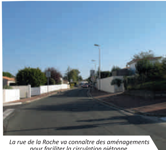
La rue de la Roche va connaître des aménagements pour faciliter la circulation piétonne.

En fin d'année, voire début 2015, les réseaux électriques et téléphoniques de la rue de Royan seront enfouis entre le rond point d'Anglès et le centre bourg.