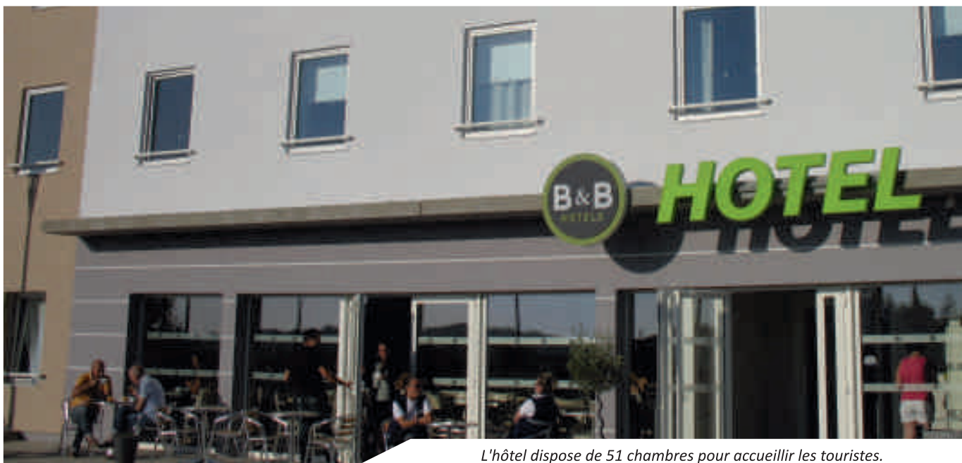
L'hôtel dispose de 51 chambres pour accueillir les touristes.

Comme prévu, l'hôtel B&B a ouvert ses portes cet été, après douze mois de travaux. Avec quatre campings (Le Val Vert, Nauzan, La Roche et Chauchamp), deux hôtels (Le Bel'm et la résidence de Rohan) et des chambres d'hôtes (Le logis de Mélisandre), les possibilités d'hébergement sur notre commune sont diversifiées. Le classement de Vaux-sur-Mer en « Station de Tourisme » impose d'offrir des hébergements de nature et catégorie variées. Il manquait à notre commune un hôtel d'une chaîne internationale; c'est chose faite avec l'implantation du groupe B&B.