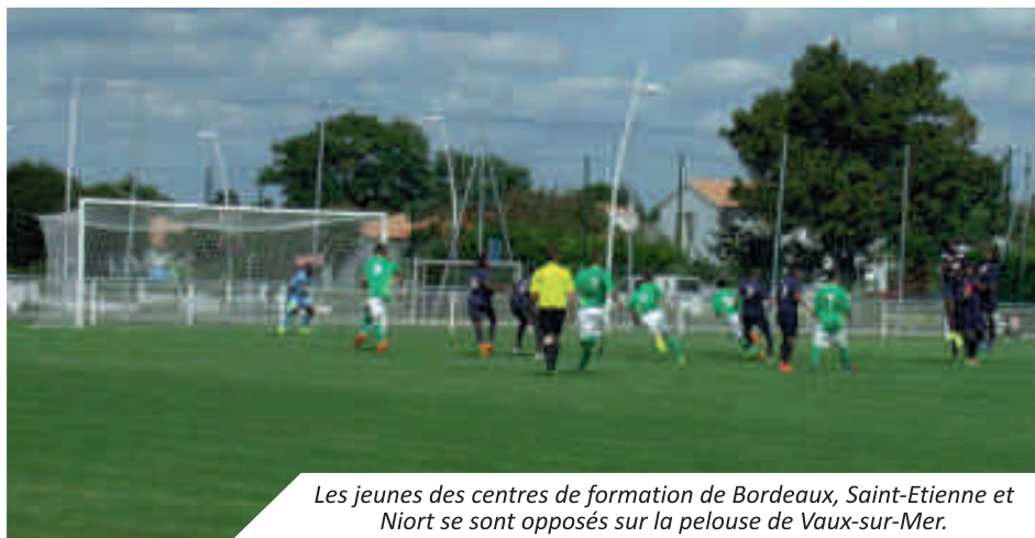
Les jeunes des centres de formation de Bordeaux, Saint-Etienne et Niort se sont opposés sur la pelouse de Vaux-sur-Mer.

Le mardi 19 août et le jeudi 21 août se sont affrontés sur le terrain de football du stade Guy Charré à Vaux-sur-Mer, les meilleurs joueurs des centres de formation de Bordeaux, de Saint-Etienne et de Niort.