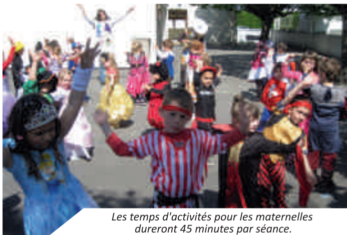
Les temps d'activités pour les maternelles dureront 45 minutes par séance.

Dans le souci de garder un rythme régulier nécessaire aux enfants de cet âge nous avons choisi quatre séances de 45 minutes à l'école maternelle. Il est difficile de garder l'attention des très jeunes enfants plus longtemps.