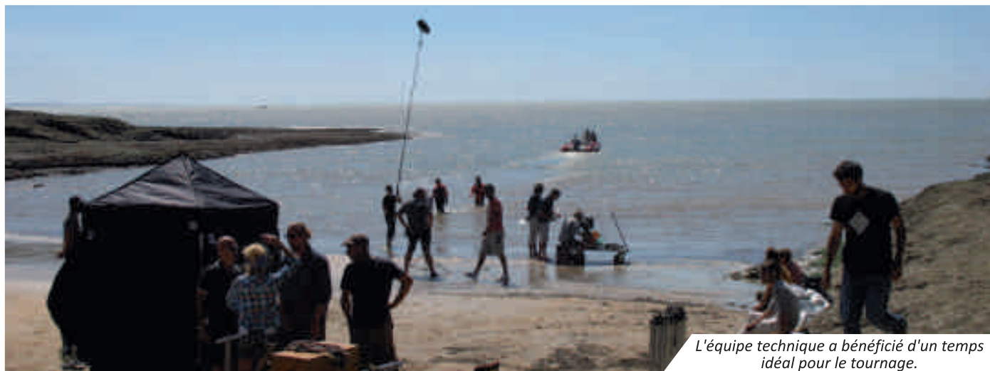
L'équipe technique a bénéficié d'un temps idéal pour le tournage.

L'an passé, notre commune avait eu le plaisir d'accueillir le tournage du film « Les vacances du Petit Nicolas 2 » avec Kad Mérad, sur la plage de Nauzan.