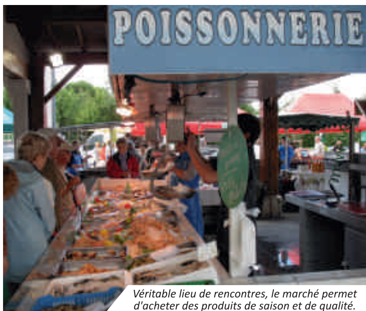
Véritable lieu de rencontres, le marché permet d'acheter des produits de saison et de qualité.

Des mesures favorisant l'accueil des commerçants itinérants ont été mises en place par la mairie afin de leur faciliter l'accès au marché et de récompenser leur présence. Les résultats s'en sont ressentis puisque le marché est passé de 483 commerçants itinérants durant l'été 2013 à 588 pour cet été, soit une augmentation de 22%.