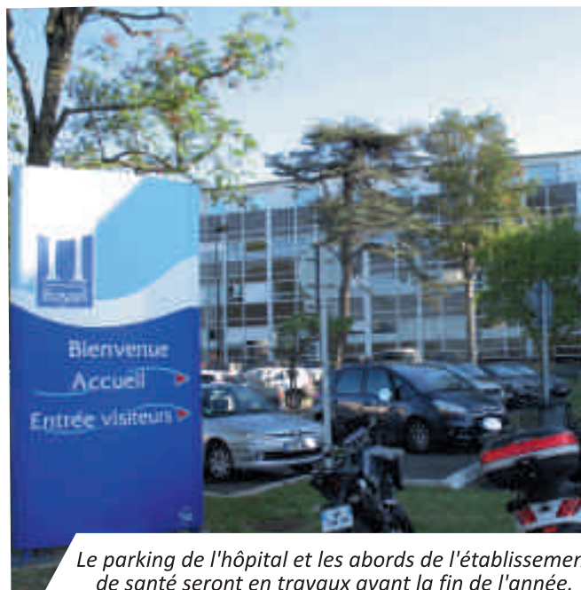
Le parking de l'hôpital et les abords de l'établissement de santé seront en travaux avant la fin de l'année.