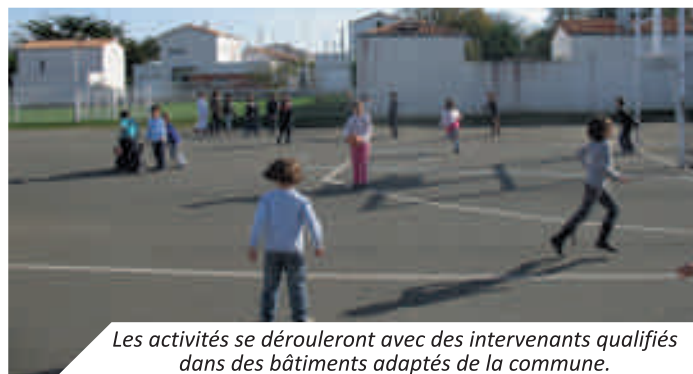
Les activités se dérouleront avec des intervenants qualifiés dans des bâtiments adaptés de la commune.

Elle a de plus mis en place un temps de surveillance des enfants le mercredi de 12h à 12h30 pour les parents qui travaillent et qui peuvent difficilement être à midi à la sortie de l'école, toujours dans un souci de faciliter la vie de ces familles.