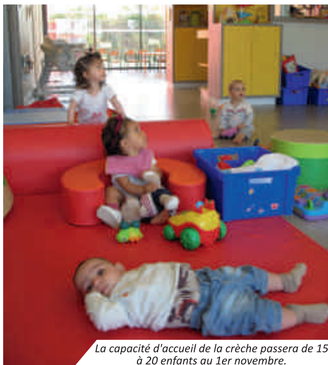
La capacité d'accueil de la crèche passera de 15 à 20 enfants au 1er novembre.