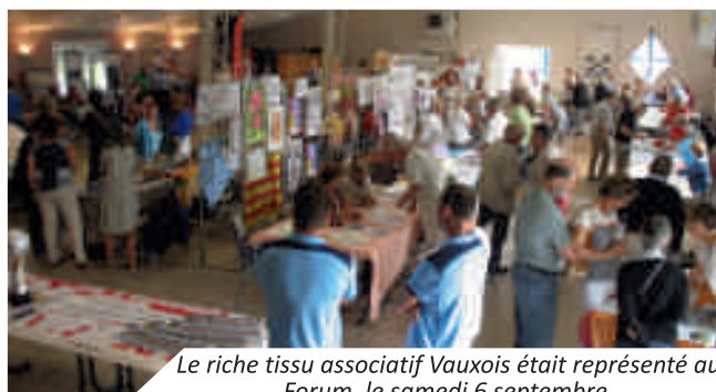
Le riche tissu associatif Vauxois était représenté au Forum, le samedi 6 septembre.

31 associations ont renseigné les personnes à la recherche d'informations pour leur rentrée associative, quel que soit le secteur recherché : santé-social, culture, sport, loisirs, solidarité. Le Forum des Associations reste un rendez-vous incontournable et idéal pour trouver son bonheur, son inspiration ou simplement échanger.