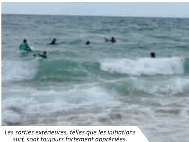
Les sorties extérieures, telles que les initiations surf, sont toujours fortement appréciées.