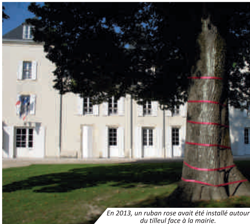
En 2013, un ruban rose avait été installé autour du tilleul face à la mairie.

Plus de renseignements : Lucide 17 : 05 46 90 17 22