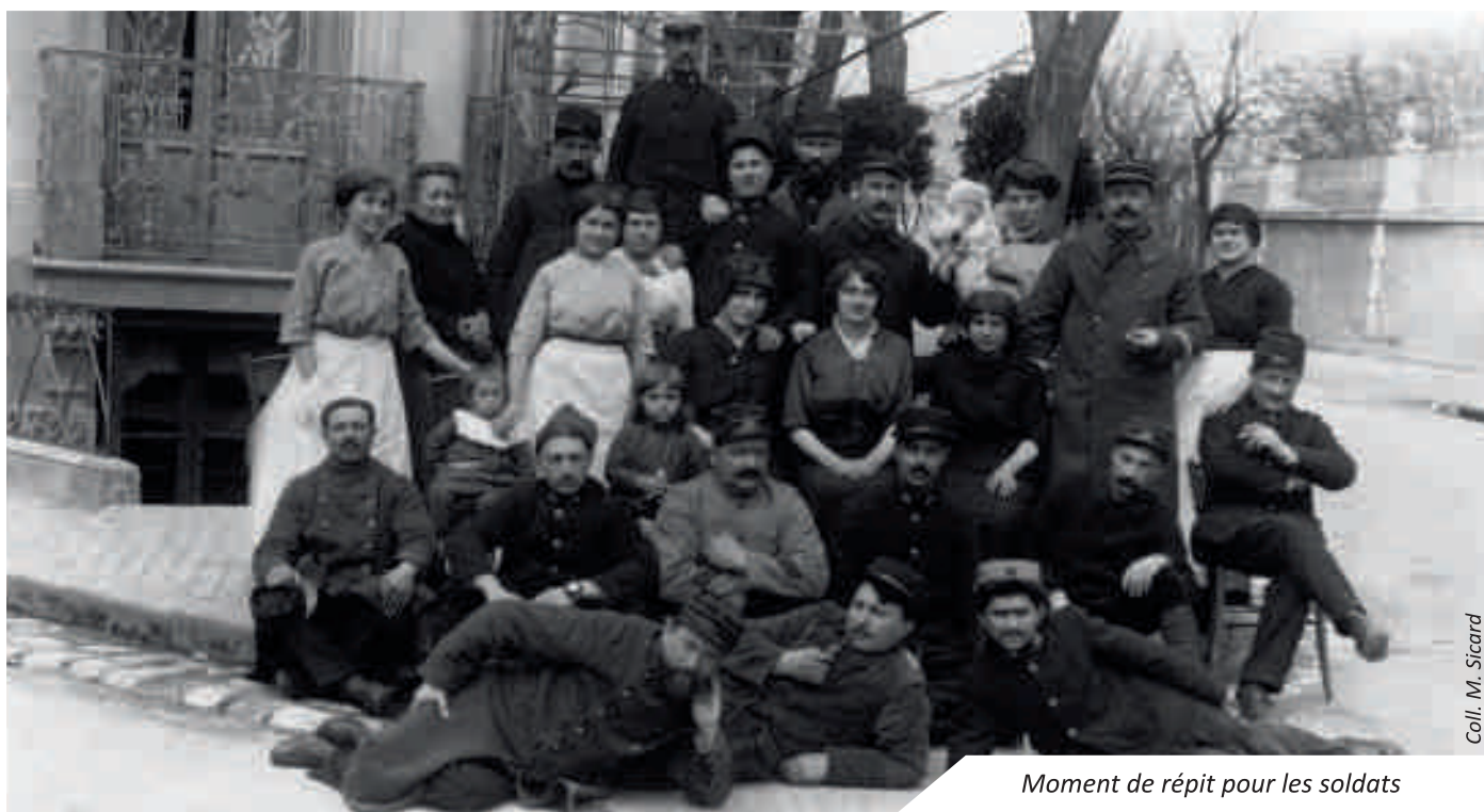
Moment de répit pour les soldats

On pourrait croire que la Côte de Beauté n'a vécu la guerre de 14-18 qu'à travers les deuils frappant trop souvent les familles. Pourtant, les habitants du Pays Royannais ont vu leur quotidien profondément bouleversé par la Grande Guerre.