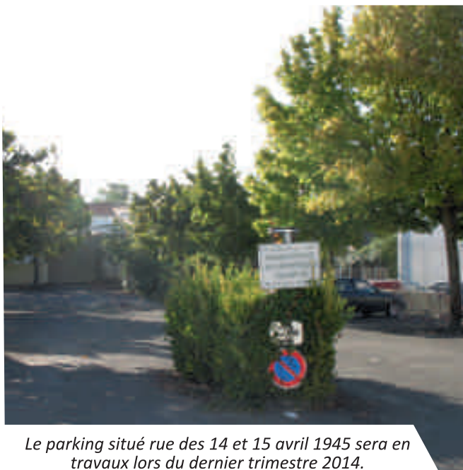
Le parking situé rue des 14 et 15 avril 1945 sera en travaux lors du dernier trimestre 2014.