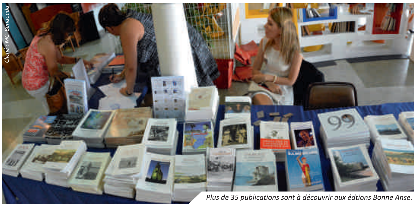
Plus de 35 publications sont à découvrir aux éditions Bonne Anse.

Dans le même esprit de valorisation de l'histoire et du patrimoine, les Éditions Bonne Anse et MICRO-MEDIA ont collaboré cette année avec l'Office de Tourisme de Vaux-sur-Mer pour réaliser un nouveau guide d'accueil présentant les atouts de la commune.