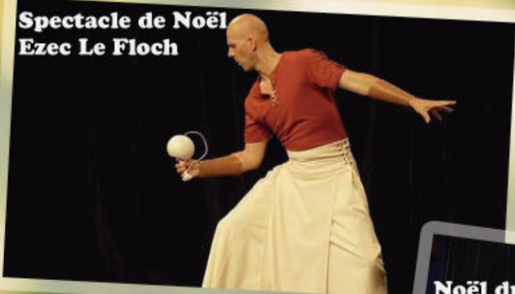
Spectacle de Noël Ezec Le Floch