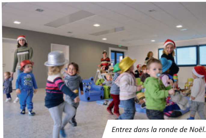
Entrez dans la ronde de Noël.

La crèche municipale « Petit à Petit » est ouverte de 7h30 à 18h30, tous les jours ainsi qu'en période de vacances scolaires. Selon le planning, des places sont disponibles pour des séances de jeux « en occasionnel ». N'hésitez pas à vous inscrire :