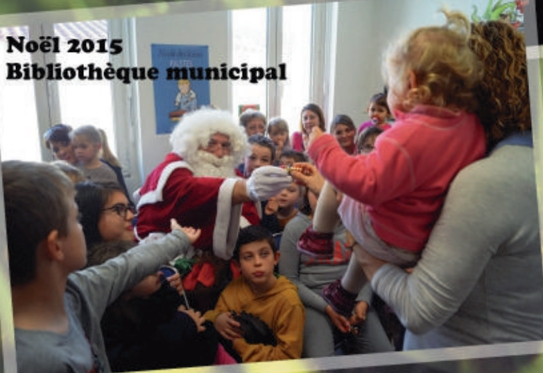
Noël 2015 Bibliothèque municipale