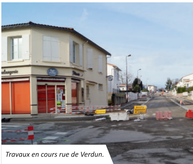
Travaux en cours rue de Verdun.