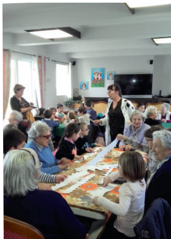
Une rencontre a été organisée le 26 janvier entre les résidents du Logis de Vaux et les élèves de CE1 avec le partage de la galette.