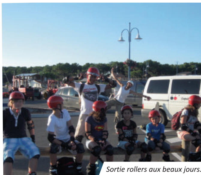
Sortie rollers aux beaux jours.

Les vacances de Pâques seront l'occasion pour les jeunes de participer à un programme d'activités riche entre sorties au cinéma et Laser Lander, activités et rencontres avec les autres Espaces Jeunes du Pays Royannais ainsi que deux animations en soirée.