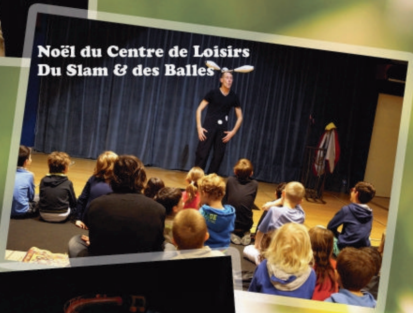
Noël du Centre de Loisirs Du Slam & des Balles