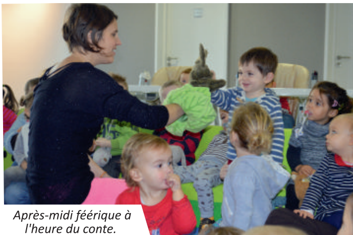
Après-midi féérique à l'heure du conte.

Afin de terminer l'année en beauté, les membres du personnel de la crèche ont invité les parents et grands-parents à se joindre à eux pour un temps convivial. Dans la salle Nacarat, petits et grands ont partagé un bon goûter préparé par les parents.