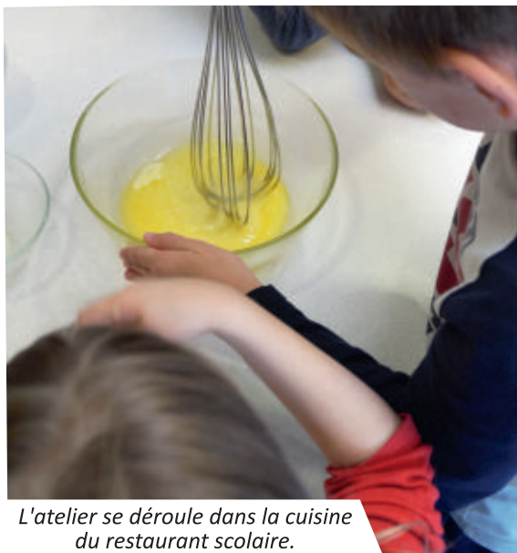
L'atelier se déroule dans la cuisine du restaurant scolaire.

Dans le cadre du Temps d'Activité Périscolaire, les enfants s'exercent à la cuisine et plus particulièrement à la pâtisserie, activité animée par Nathalie Aluti-Perez, régisseur du restaurant scolaire. Cet atelier connaît un franc succès car, à chaque période, ce sont 3 groupes de 15 enfants qui y participent.