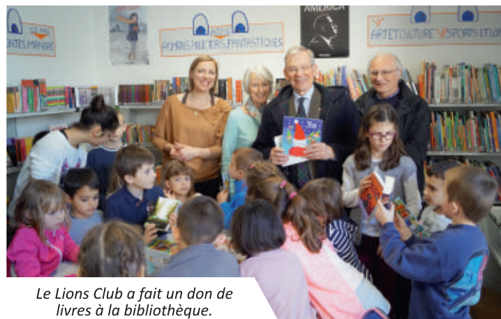
Le Lions Club a fait un don de livres à la bibliothèque.