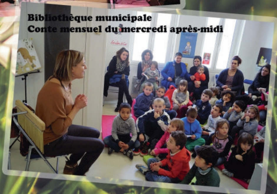
Bibliothèque municipale Conte mensuel du mercredi après-midi