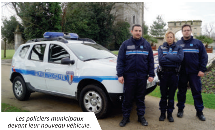
Les policiers municipaux devant leur nouveau véhicule.

En ce début d'année, le service de la Police Municipale vient d'être doté d'un nouveau véhicule. Cette acquisition répond à un réel besoin, en effet le véhicule précédent ne permettait pas d'accéder aux endroits les plus reculés de la commune. Cet équipement a également été choisi pour sa faible consommation, son faible impact écologique et son rapport qualité/prix.