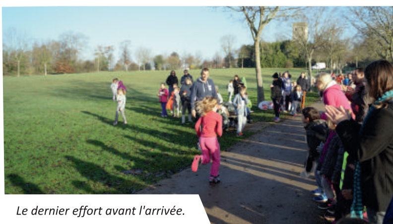
Le dernier effort avant l'arrivée.