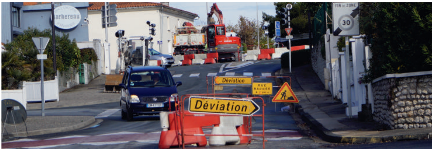
QUELQUES TRAVAUX RÉALISÉS DÉBUT 2016 :