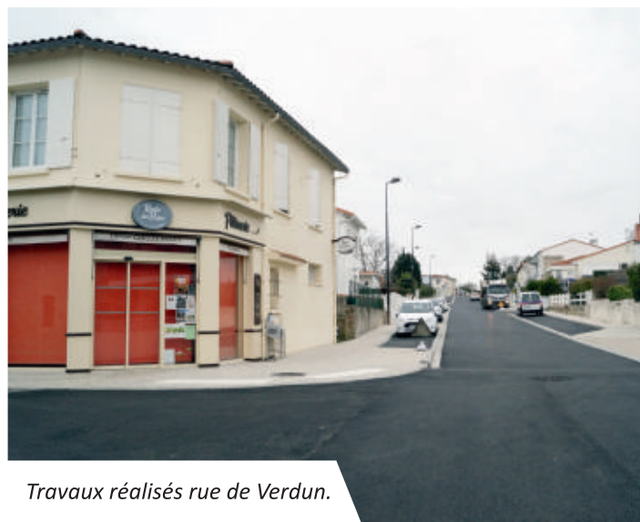
Travaux réalisés rue de Verdun.