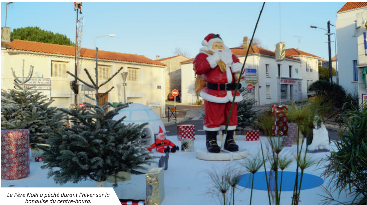
Le Père Noël a pêché durant l'hiver sur la banquise du centre-bourg.

Comme chaque hiver, les Services Techniques de la ville se sont mobilisés pour l'installation des illuminations et décorations. Les employés ont coutume d'implanter un imposant décor sur le rond-point du centre bourg.