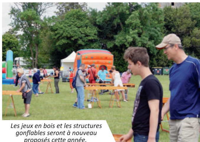
Les jeux en bois et les structures gonflables seront à nouveau proposés cette année.

- La Fête de la Nature de Vaux-sur-Mer s'associe au Forum de l'Environnement de Saint-Palais-sur-Mer afin de proposer une programmation complète sur tout le week-end.