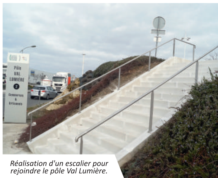
Réalisation d'un escalier pour rejoindre le pôle Val Lumière.