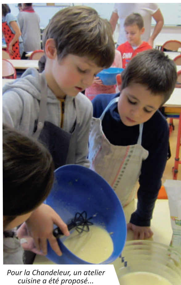
Pour la Chandeleur, un atelier cuisine a été proposé...