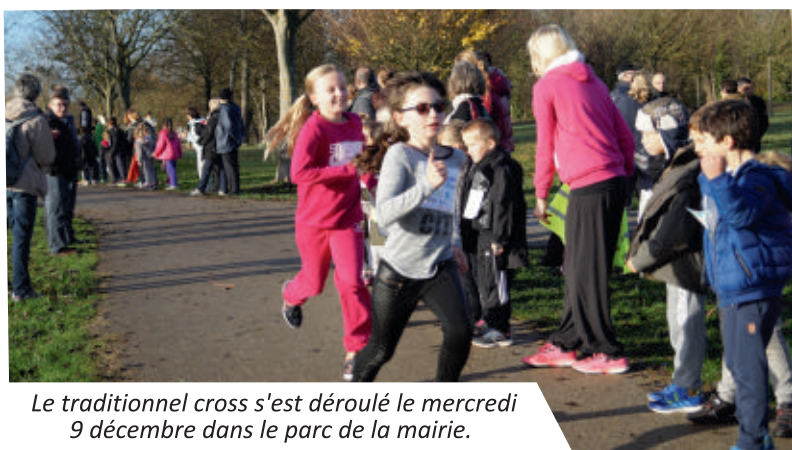
Le traditionnel cross s'est déroulé le mercredi 9 décembre dans le parc de la mairie.

Diverses sorties, visites ou interventions sont proposées aux élèves de l'école de Vaux-sur-Mer afin de favoriser une meilleure intégration ou d'approfondir un contenu pédagogique. Retour en images sur quelques activités proposées cet hiver :