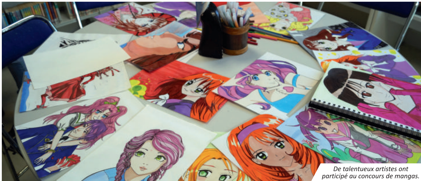
De talentueux artistes ont participé au concours de mangas.

La bibliothèque de Vaux-sur-Mer connaît depuis quelques mois une progression de ses adhérents avec plus de 500 lecteurs. Des animations multiples et variées, proposées aux petits comme aux grands, permettent d'attirer de nouveaux lecteurs, d'échanger avec eux, de nouer un lien social et de valoriser ce lieu culturel.