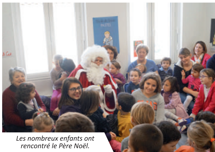
Les nombreux enfants ont rencontré le Père Noël.

Les enfants sont venus écouter la légende des treize poussins et rencontrer le Père Noël le mercredi 9 décembre.