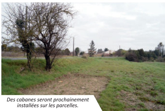
Des cabanes seront prochainement installées sur les parcelles.

Les jardins familiaux, gérés par la municipalité et le Centre Communal d'Action Sociale, sont constitués d'un ensemble de parcelles potagères.