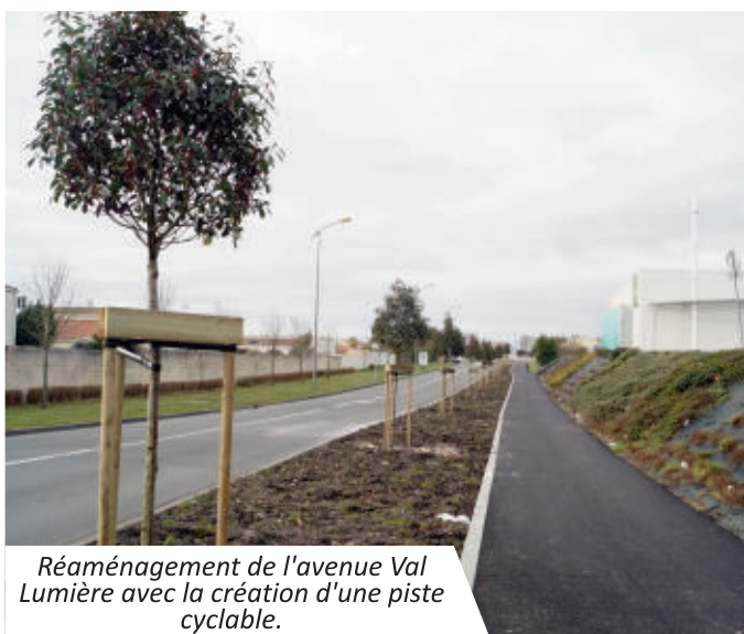
Réaménagement de l'avenue Val Lumière avec la création d'une piste cyclable.