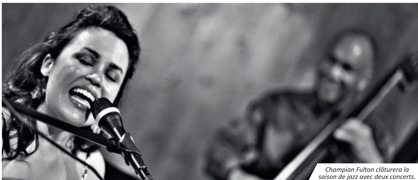
Champion Fulton clôturera la saison de jazz avec deux concerts.

La saison Jazz in Vaux 2015-2016 se terminera le samedi 19 mars avec la venue de la talentueuse chanteuse américaine Champion Fulton. Cette 13ème édition aura une nouvelle fois été haute en couleurs avec une programmation éclectique et de qualité.