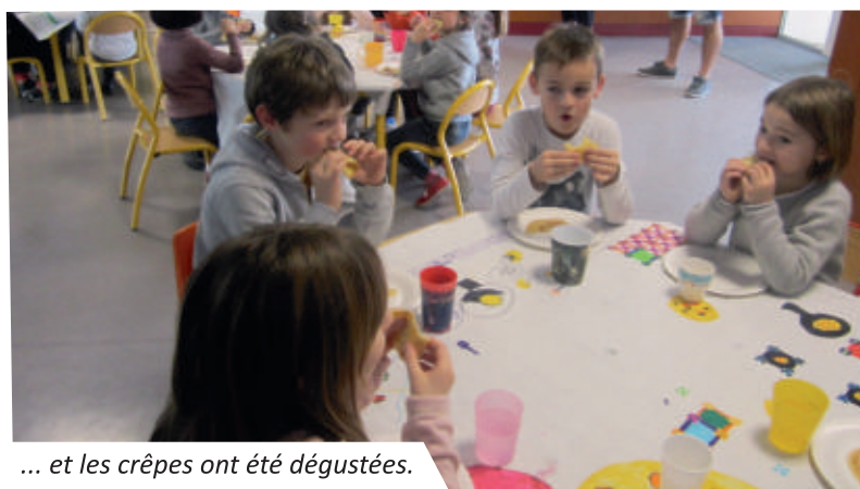
... et les crêpes ont été dégustées.