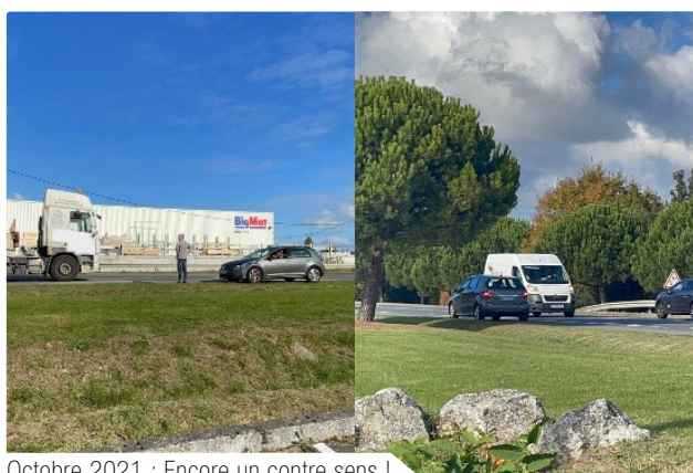
Octobre 2021 : Encore un contre sens !

Nous espérons que notre contribution dans ce magazine municipal de fin d'année, verra une solution pour 2022.