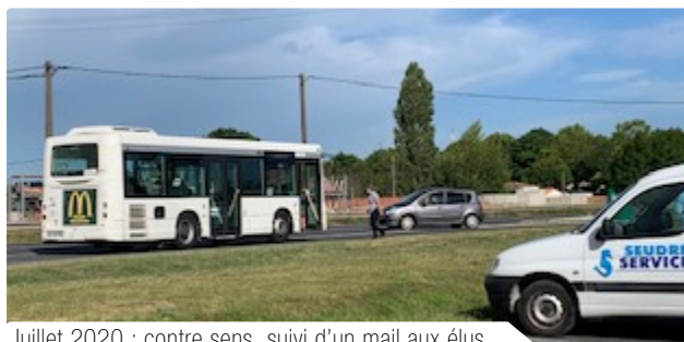
Juillet 2020 : contre sens ,suivi d'un mail aux élus